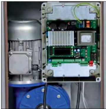
HYPERFOR 4000-I - cuadro de maniobras HEAVY1