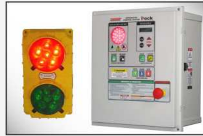
iDock Controls incluyen comunicación por luces y que se pueden integrar con cualquier otro equipo de andén.