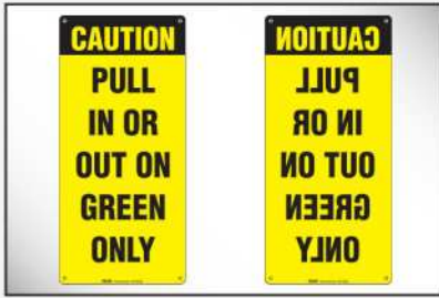
Un juego de señales de atención estándar y reflejadas notifican al conductor del camión.