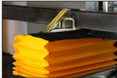
El motor y la bomba autónomos de PowerStop® se pueden montar de manera remota.