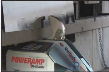
El mecanismo de bloqueo mantiene el enganche incluso en remolques intermodales o en una protección contra impacto posterior (RIG) obstruida.