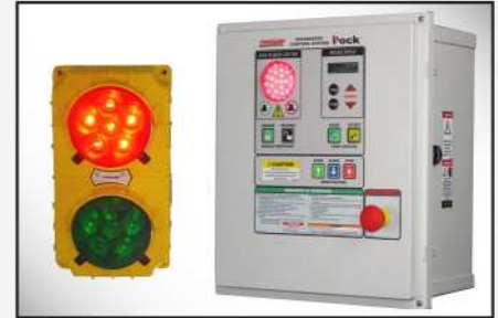
iDock Controls incluyen comunicación por luces y que se pueden integrar con cualquier otro equipo de andén.