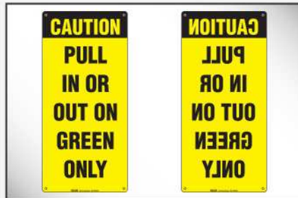
Un juego de señales de atención estándar y reflejadas notifican al conductor del camión.