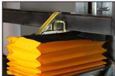
La unidad de accionamiento manual PowerStop® se puede ajustar y liberar fácilmente del muelle/andén, gracias a su palanca de activación incluida.