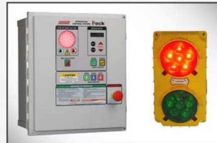
iDock Controls mejorados opcionales que incluyen comunicación por luces y que se pueden integrar con cualquier otro equipo de andén.