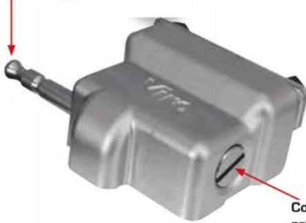
Coraza rotatoria a prueba de taladro

Vástago rotatorio, con cabeza del vástago con ruptura programada a prueba de desgarro