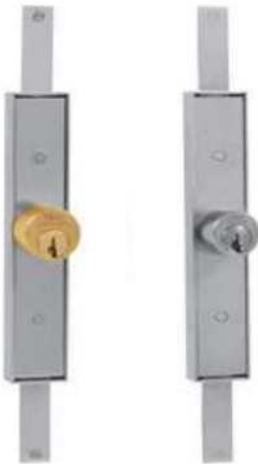
ART. 1.8301 ART. 8300

Son posibles todas las ejecuciones especiales en el cilindro.